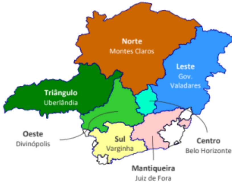
Área de Atuação

Informações relativas ao interesse público que justificou a criação da Companhia, a atuação da Companhia em atendimento às políticas públicas (incluindo metas de universalização), bem como ao processo de formação de preços e regras aplicáveis à fixação de tarifas e outras informações específicas às sociedades de economia mista, estão dispostas no item 1.10 deste Formulário de Referência.