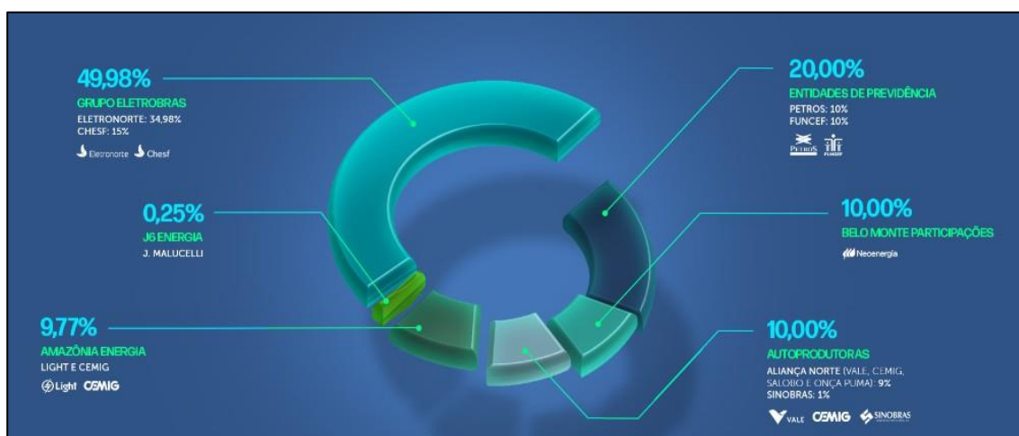
Figura 1 – Arranjo societário da Nesa

A Amazônia é uma Sociedade de Propósito Específico formada pela Cemig Geração e Transmissão S. A. (“Cemig GT”), que em 31 de dezembro de 2023, detinha 49% do capital votante e 74,5% do capital total, e pela Light S.A. (“Light”), que em 31 de dezembro de 2023, detinha 51% do capital votante e 25,5% do capital total. O propósito é a participação no capital social da Norte Energia S. A. (“Norte Energia” ou “Nesa”), detentora da concessão da Usina Hidrelétrica Belo Monte (“UHE Belo Monte” ou “Empreendimento”). Em 31 de dezembro de 2023 a Companhia detinha 9,77% de participação no Empreendimento. A figura 1 retrata o arranjo societário da Nesa: